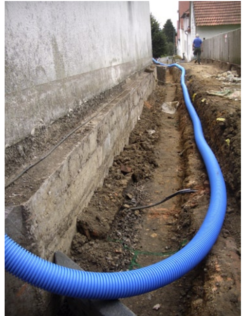
Die neue Wasserführung