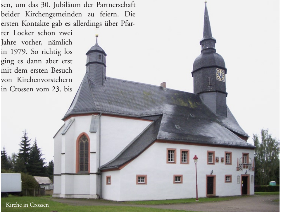
Kirche in Crossen