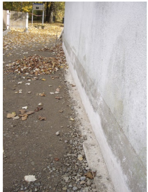
Der Graben, in dem die neue Wasserführung verlegt wurde, ist wieder verfüllt. Gut sichtbar: die Abdichtung unten an der Kirchenaußenwand